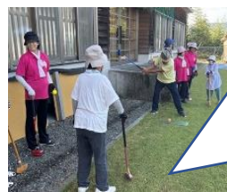
【グランドゴルフ大会】

グランドゴルフ大会の他にも、8月18日(日)にPTA奉仕作業がありました。たくさんお地域の方々から早朝から御協力いただき、学校がきれいになりました。ありがとうございました。